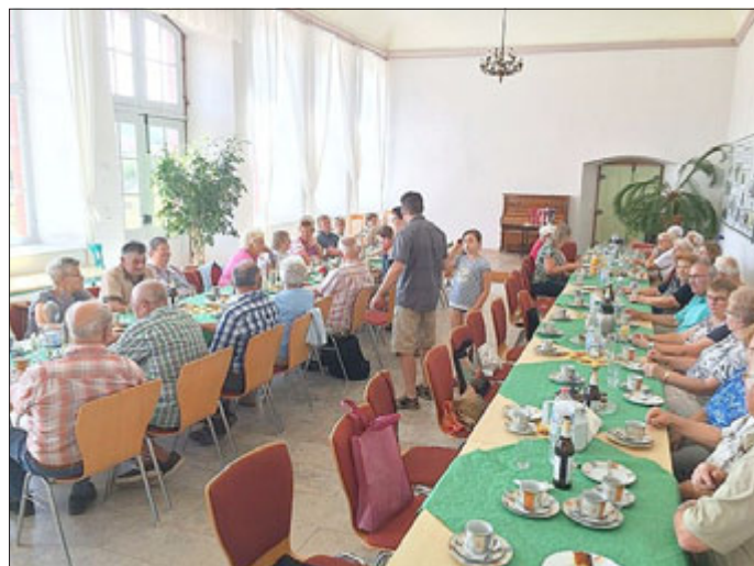
Sommerfest VdK Bendeleben