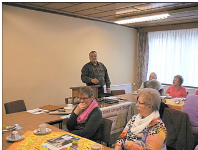
Vortrag „Weisser Ring“