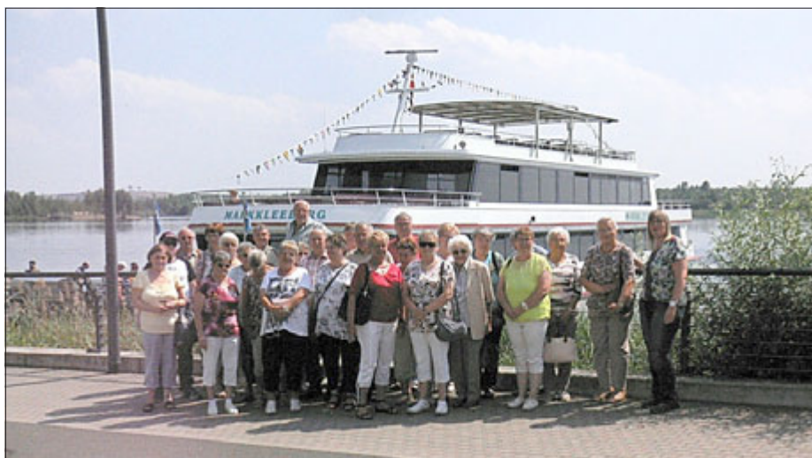
Busreise nach „Neuseeland“

„Der Sozialverband VdK Deutschland e. V. (VdK = Verband der Kriegsbeschädigten, Kriegshinterbliebenen und Sozialrentner Deutschlands) ist mit 2 Millionen Mitgliedern der größte Sozialverband Deutschlands. Er vertritt die sozialpolitischen Interessen aller Bürgerinnen und Bürger. Politisch setzt sich der Sozialverband VdK für einen starken Sozialstaat, eine tragfähige gesetzliche Sozialversicherung und soziale Gerechtigkeit ein. Die Themen des Sozialverbands reichen von Rente, Gesundheit und Pflege bis hin zu Teilhabe, Leben im Alter und soziale Sicherung.“ Auszug aus Wikipedia