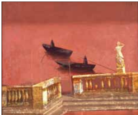
ASILJE JORDAN, „LAGUNE“, 1995, Öl auf Leinwand, 50 x 60 cm, Privatsammlung, Zagreb

Der Maler Vasilje Jordan, 1934 in Zagreb geboren, gilt als einer der bedeutendsten zeitgenössischen Künstler Kroatiens. Er lehrte viele Jahre als Professor an der Akademie der Schönen Künste in Zagreb. Die Bilder des hierzulande wenig bekannten Künstlers stellt das Panorama Museum in einer großen Sonderausstellung vor, die rund 90 Werke versammelt, darunter 60 Gemälde und 30 Arbeiten auf Papier. Realisiert wird diese Schau in Zusammenarbeit mit der Familie des Künstlers und der Moderna Galerija in Zagreb, dem kroatischen Nationalmuseum der Moderne. In ihr entfaltet sich die metaphysisch surreale Bühnenwelt des Meisters vor dem Besucher.