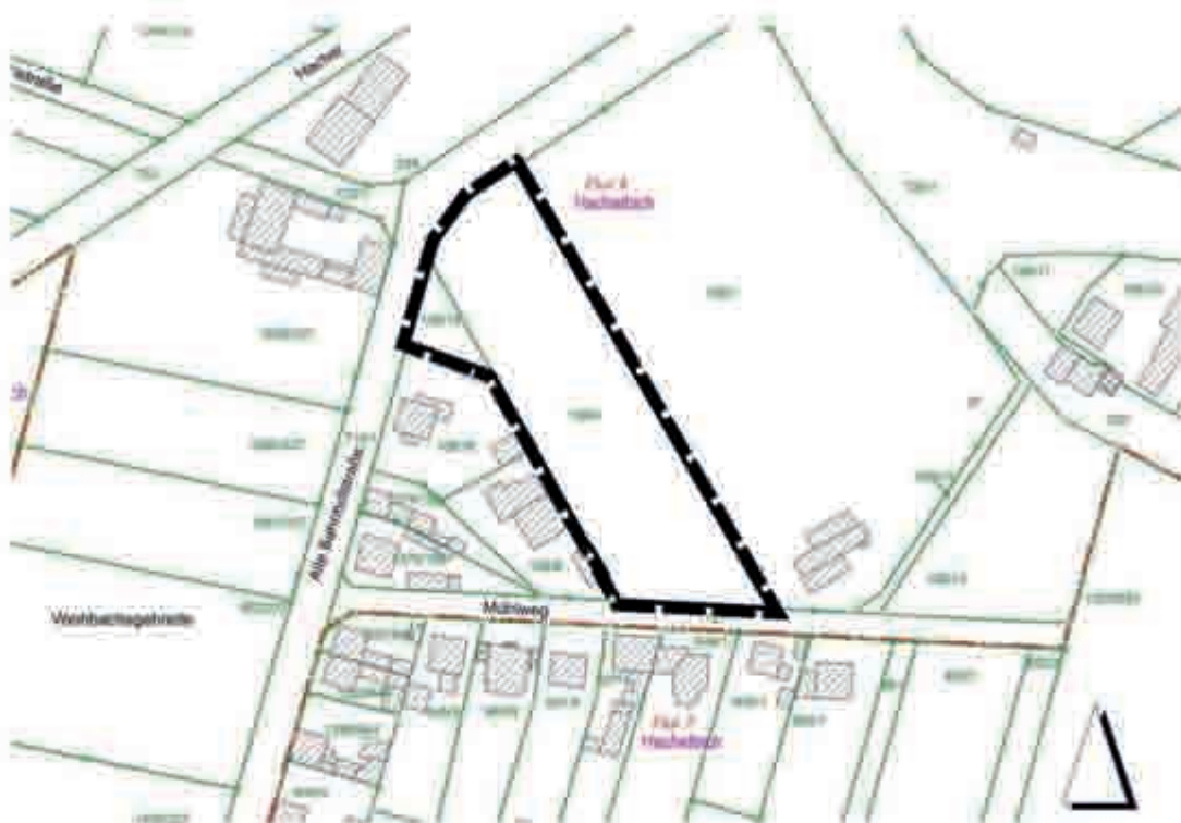
Darstellung ohne Maßstab