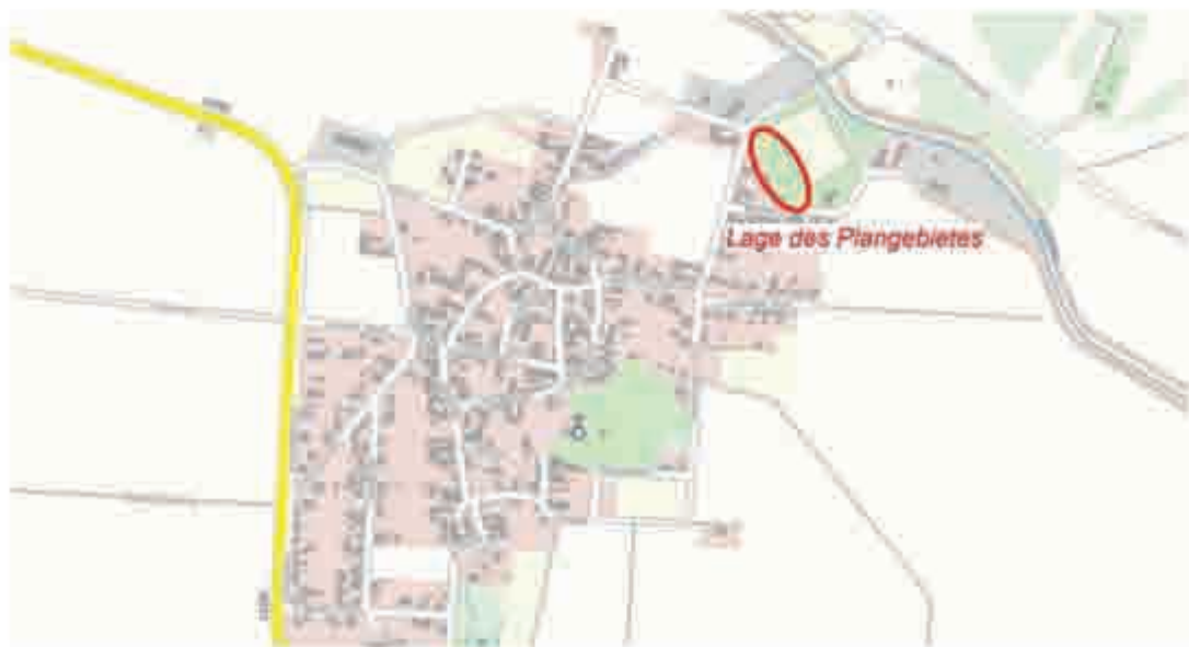
Darstellung ohne Maßstab