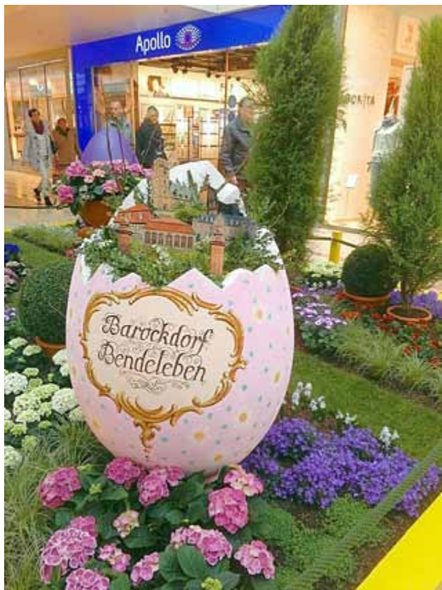
Knut Hoffmann Bürgermeister

Für alle Interessierten können die verschiedenen Ostereier der Außenstandorte der BUGA 2021 noch bis Ostersonntag im Erdgeschoss des ThüringenParks Erfurt angesehen werden.