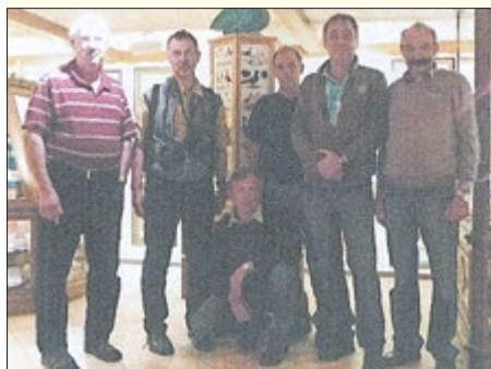
Besuch im Taubenmuseum 2015

Schon 1925 beschickten Karl Schweser und Hugo Koch eine Ausstellung in Hannover. Ab 1931 wurde das erste Protokollbuch eingeführt. Leider ist es noch verschollen.