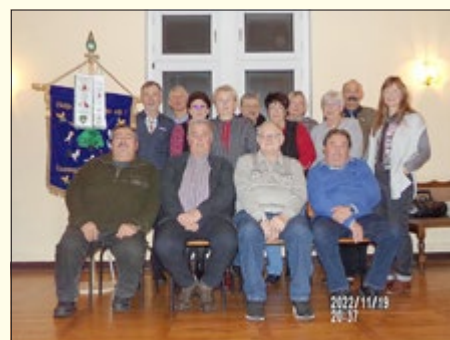
Teilnehmer der Jahreshauptversammlung 2022

Am 12. Juni 2022 ist nach 2-jähriger Abstinenz wieder ein Hähnekrähen in Badra mit großer Resonanz veranstaltet worden. Auch aus Anlass des 825. Geburtstages unseres Dorfes haben wir im September unseren Beitrag zu den Feierlichkeiten geleistet. Wir zeigten unsere Rassen zu Beginn des Festumzuges in einer Reihe Schaukäfige allen anwesenden Gästen. Am besagten Festumzug nahmen alle Vereinsmitglieder mit Vereinsfahne teil.