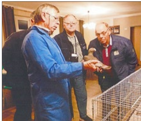
Regelmäßige Monatsschau mit Tierbesprechung

Am 24. Juni 2017 richtete der RGZV Badra das Kreiszüchertreffen in Badra aus. Die gelungene Veranstaltung bekam große Resonanz. Der Jährlich stattfindende Landeszüchertag wird von einer Vereinsdelegation regelmäßig besucht. Am 22.-23.12.2018 organisierte unser Verein anlässlich des 95. Vereinsjubiläums, eine Ortsschau auf dem Gemeindesaal. Die Beteiligung war großartig, ebenso die Beurteilung durch alle Aussteller. Rechtzeitig zur Eröffnung ist auch die neu erstellte Vereinsfahne da und kann vorgestellt werden. Sie wurde 2019 zum Landesverband in Seebach beim Fahneneinmarsch zum ersten Mal präsentiert. Immer wieder ein erhebendes Gefühl.