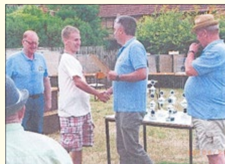
Traditionelles alljährliches Hähnekrähen

Nach der Gründung der Verwaltungsgemeinschaft „Kyffhäuser“ wurden 1995 Gemeindeverbandsschauen in den Gemeinden Seega, Badra, Steinthaleben und Rottleben abgehalten. 1997 stellten Badraer Züchter 89 Tier auf einer solchen Schau aus. Es wurden von 1995 bis 2004 zehn Gemeindeverbandsschauen in unterschiedlichen Orten durchgeführt.