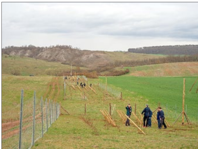
Blick über die Korridorpflanzung bei Badra