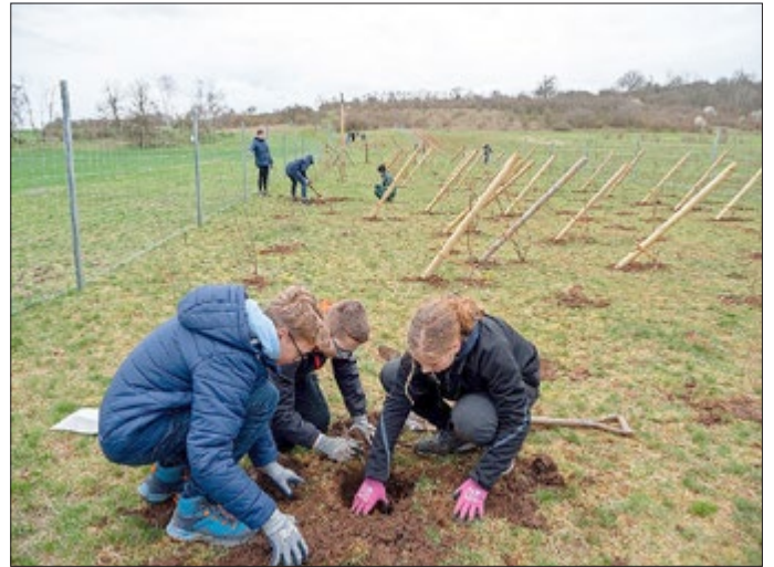
Foto: Isabell Hümpfner, Schüler*innen der Freien Gemeinschaftsschule Sondershausen pflanzen Bäume für die Wildkatze

„Die Verinselung von Lebensräumen ist eine der Hauptursachen für den Verlust der biologischen Vielfalt. Gerade Wildkatzen reagieren sehr sensibel auf die damit einhergehende Isolierung ihrer Populationen. Deshalb eignen sie sich hervorragend als Gradmesser für die Effektivität der Lebensraumvernetzung“, so Thomas Mölich, Wildkatzenexperte und Projektleiter des BUND Thüringen. Der BUND Thüringen begleitet das Vorhaben mit einem Wildkatzen-Lockstock-Monitoring in ganz Thüringen gemeinsam mit Freiwilligen. Dabei waren auch die Schüler der Freien Gemeinschaftsschule eingebunden. Diese Untersuchung ist Teil einer internationalen Studie zur Bedeutung von Wildtierkorridoren für die Lebensraumvernetzung in Europa und in den USA. Im Rahmen des Korridor-Projekts der Wildtierland Hainich werden noch weitere Bausteine umgesetzt. Dazu gehört die Erstellung eines Waldbiotopkonzepts für den Kyffhäuserkreis sowie die Pflanzung eines weiteren Korridors auf einer ehemaligen Panzertrasse im Landkreis Gotha zwischen dem Südlichen Kindel und dem Kranberg. Hier ist die Pflanzung für Herbst 2023 vorgesehen. Von diesen Lebensraumvernetzungen profitieren in Zukunft nicht nur Wildkatzen, sondern auch Luchse, Insekten, Bilche, Fledermäuse und Vögel.