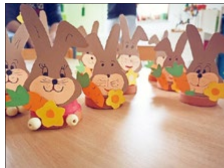
Die Erzieherinnen und Eltern der Kindertagesstätte Kinderhaus in Rottleben

Am Weltfrauentag wurde im Kinderhaus Rottleben österlich gebastelt. Auch der Schnee im März konnte die Eltern der Kita in Rottleben nicht davon abhalten, das kommende Osterfest einzuleiten. Dank der guten Vorbereitung durch die fleißigen Erzieherinnen blieb neben dem Basteln auch noch genug Zeit für ein gemütliches Beisammensein mit Kaffee und Keksen. Dann wollen wir mal hoffen, dass alle Hasen von unseren Kindern zu Ostern gefunden werden.