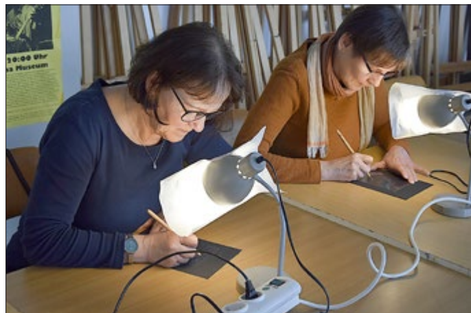
Die abgebildeten Personen haben einer Nutzung der Fotos zum Abdruck in der Presse und im Internet zugestimmt.