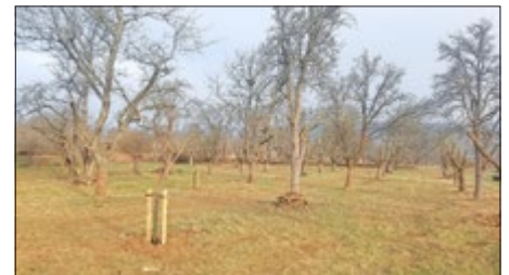
Streuobstwiese bei Rottleben nach den Pflegemaßnahmen

„Verbesserung der Agrarstruktur und des Küstenschutzes“ (GAK) finanziert. Die praktischen Arbeiten wurden von der Firma Landschaftsbau Sören Haselhuhn und Lothar Hörning Gartenbau / Landschaftspflege ausgeführt.