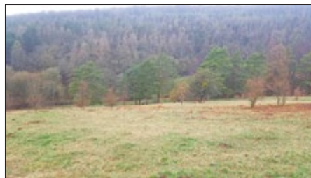
Magerrasen im Keltertal bei Steinhaleben nach der Entbuschung

halboffene, strukturreiche Landschaften erhalten. Auf der Projektfläche profitieren davon die stark gefährdeten Vogelarten Braunkehlchen und Raubwürger.