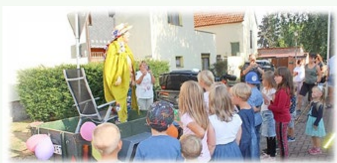
Die „Blumenfee Hilti“ überreichte die kleinen Zuckertüten