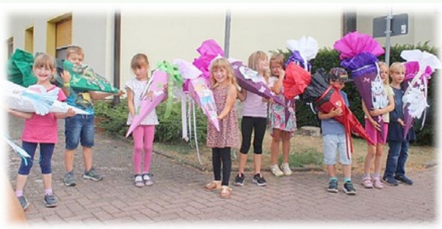
Unsere neun glücklichen Vorschüler